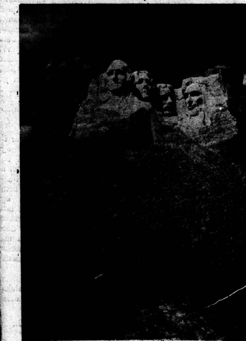
Tugu peringatan Presiden A. S. yang diukir digantung Rushmore di negara South Dakota. Dari kiri kekanan ialah: kepala da George Washington, Thomas Jefferson, Theodore Roosevelt dan Abraham Lincoln, diukir dari batu granit gunung Rushmore. Ukirannya sebagai rakan-rakan dan juga sebagai simbol rasial 60 kahi.

Pos komando komunis jang tiba2 diadakan ditempat permulaan dari parade segera menggerakkan kurang lebih 500 orang kaum kiri jang mara melanggar