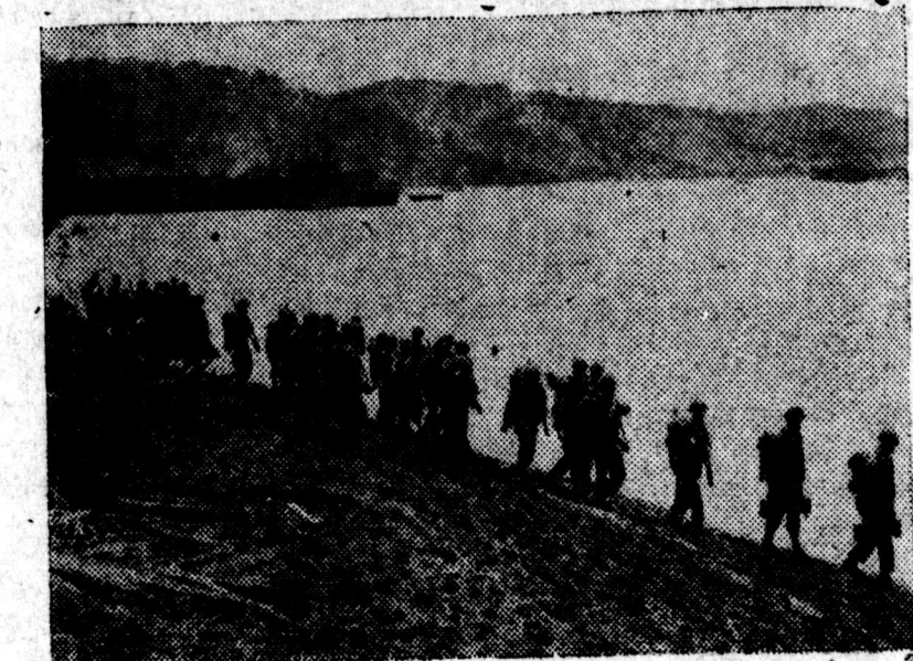
Serdadu2 A.S. mara disepandjang pantai dekat Hollandia (New Guinea) ditahun 1944.